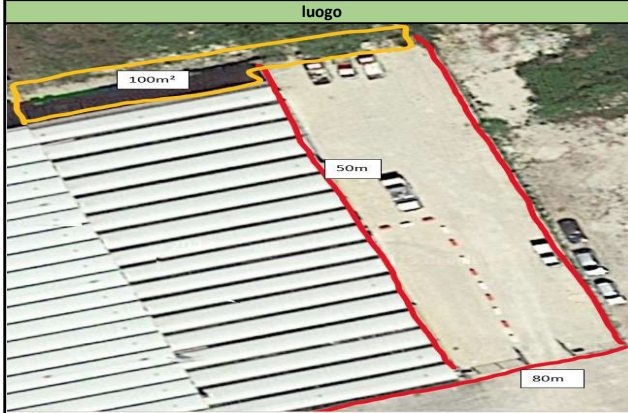
CDR Socciglia TAV.7