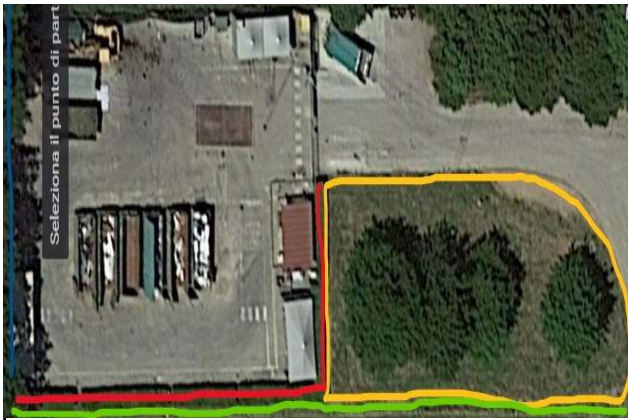
Colle di Compito TAV.5