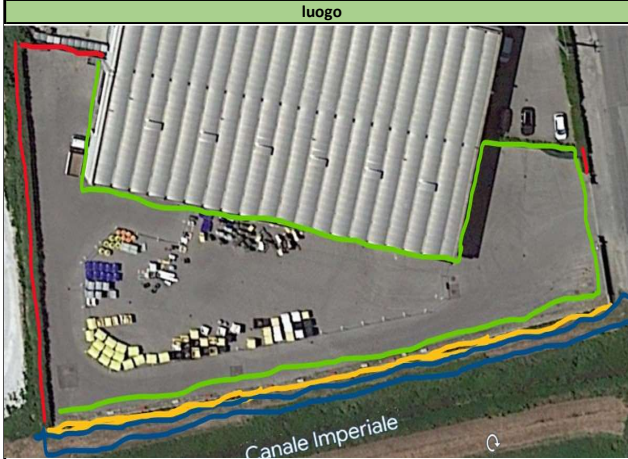
CDR Altopascio TAV.6